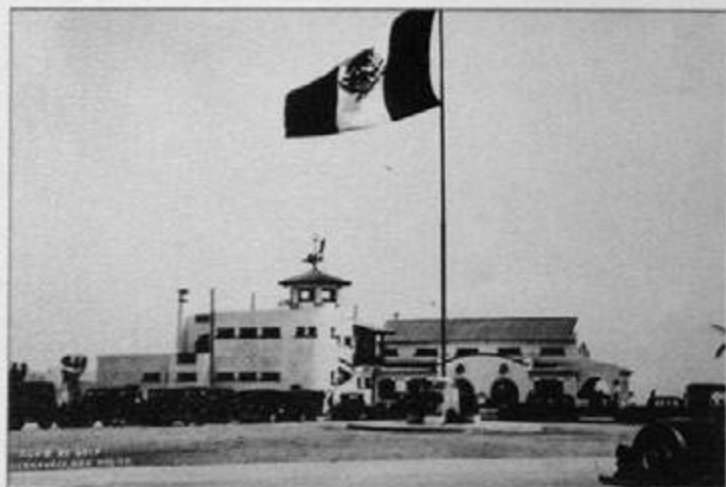
Club de Golf de Cuernavaca